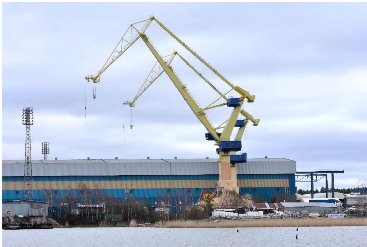
Turun telakan nostureita.

Turku 2029 kaupunkistrategian keskeisenä tavoitteena on elinkeinoelämän kilpailukykyyn edistäminen kestäväällä tavalla. Tarjotessaan yrityksille kilpailukykyisen ja yritysystävällisen toimintaympäristön kaupunki houkuttelee myös kansainvälisiä osaajia ja yrityksiä.