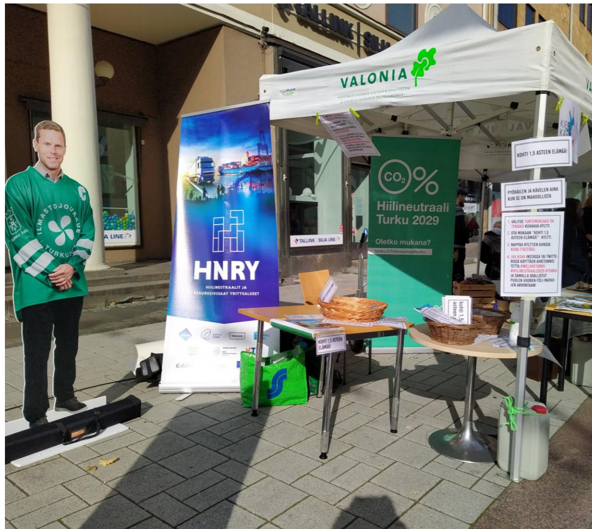
Hiilineutraali Turku ja Ilmastojoukkue Turun päivänä 2020.

Jotta kunnianhimoiset tavoitteet saavutetaan, tarvitaan ilmastotyöhön mukaan yritykset ja asukkaat.