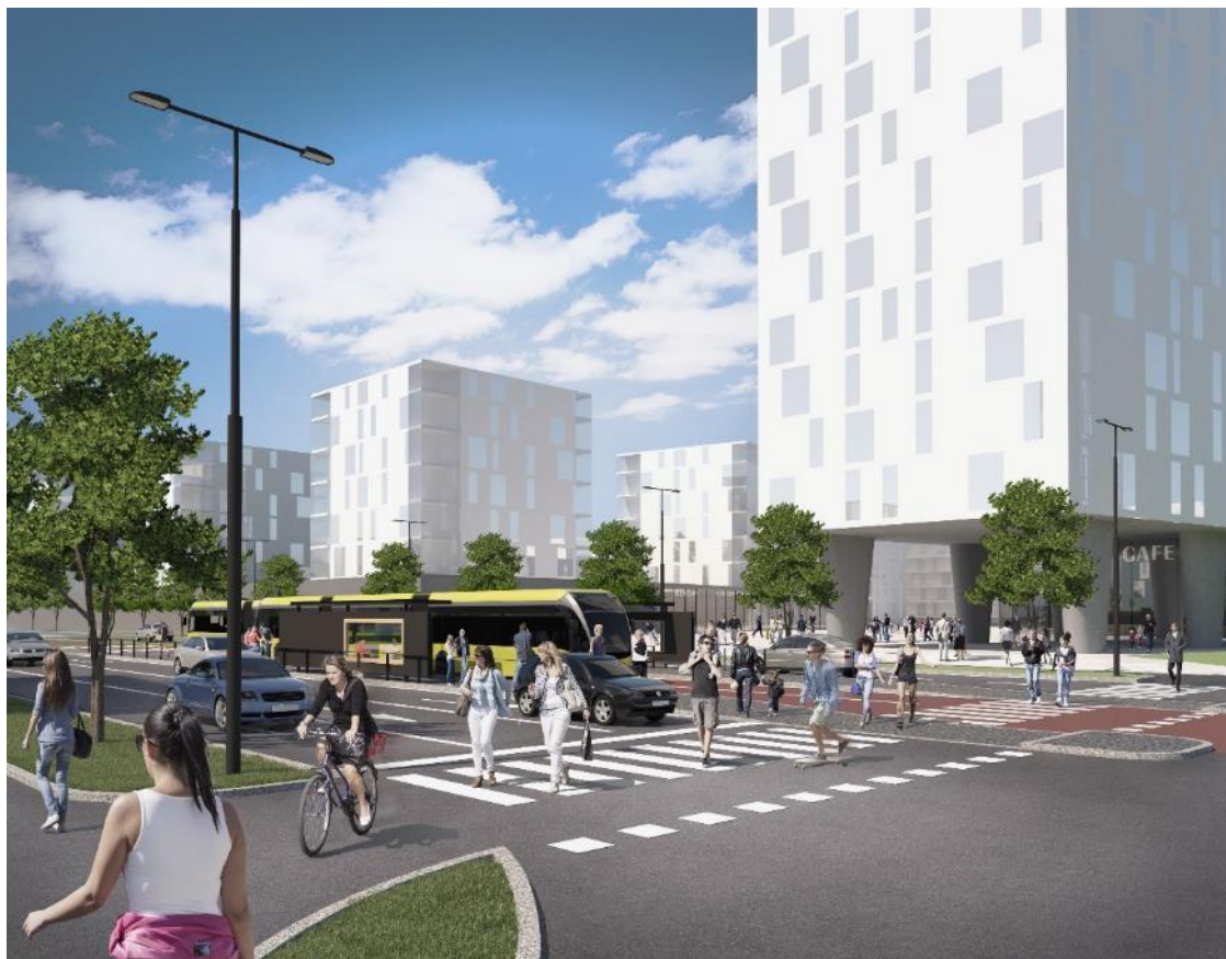
Havainnekuva, Sigge Arkkitehdit Oy.

Ilmastotavoitteiden saavuttamiseksi on investoitava päästövaikutuksiltaan merkittävimpiin kohteisiin, kuten uusiutuvaan energiaan, vähähiilliseen liikkumiseen ja kestäväan kaupunkirakenteeseen.