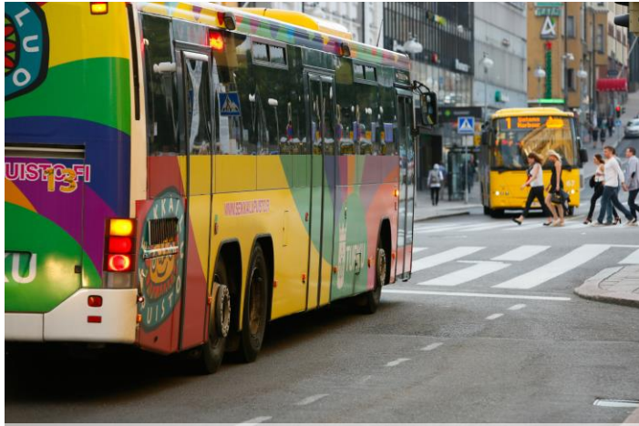
Föli-busseja Turun keskustassa.