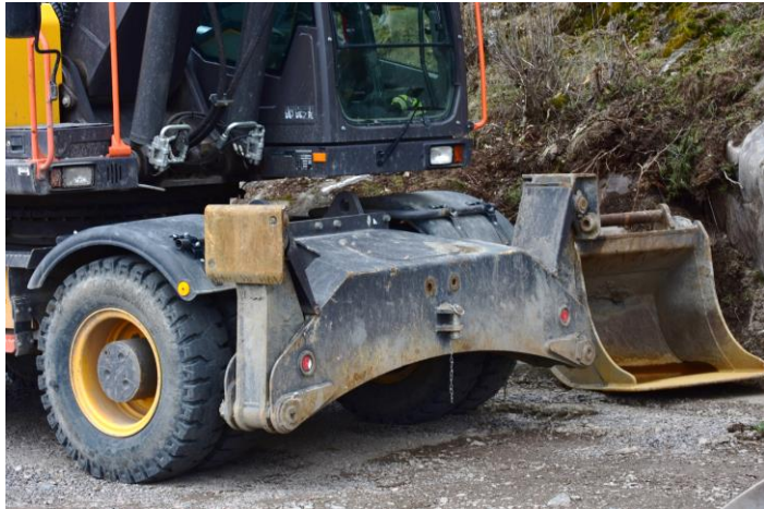
Työkoneiden päästöihin vaikutetaan hankintakriteereillä.