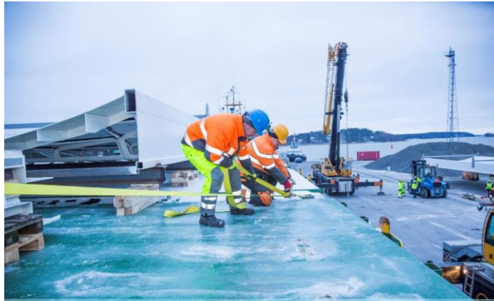
Rahdin pakkausta Turun satamassa.