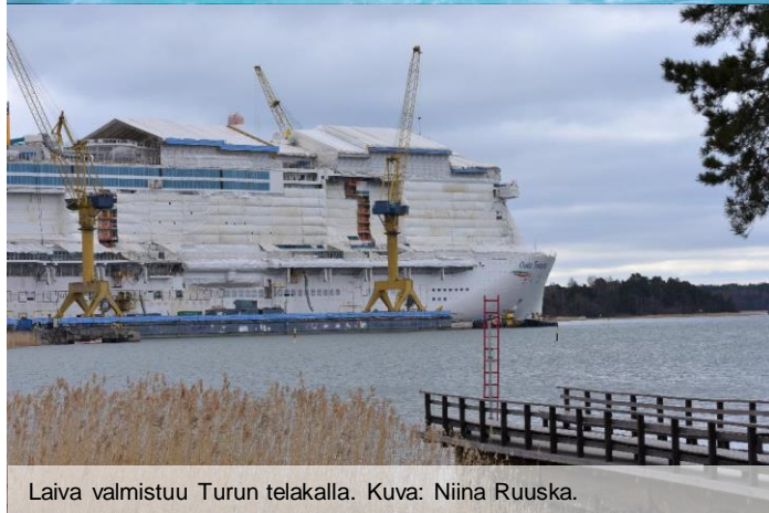
Laiva valmistuu Turun telakalla.

Kaupunki voi vaikuttaa yritysten ilmastotavoitteiden etenemiseen myös tarjoamalla tukea erilaisten yhteistyöverkostojen kautta.